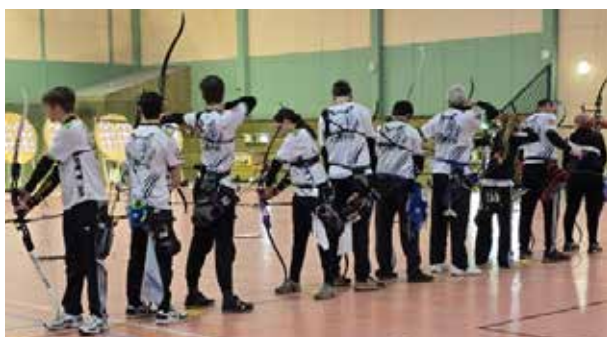
Concours janvier 25

Le second rendez-vous s'annonce exceptionnel : le club accueillera le Championnat de l'Eure des catégories adultes. Pendant deux jours, les archères et archers Eurois s'affronteront au stade Gachassin de Thuit-de-l'Oison pour décrocher le titre de champion départemental. En arc nu, classique ou à poulies, seniors 1, 2 ou 3, femmes et hommes confondus, près d'une centaine de compétiteurs sont attendus.