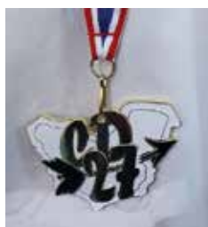
Médaille du Championnat de l'Eure

Le second rendez-vous s'annonce exceptionnel : le club accueillera le Championnat de l'Eure des catégories adultes. Pendant deux jours, les archères et archers Eurois s'affronteront au stade Gachassin de Thuit-de-l'Oison pour décrocher le titre de champion départemental. En arc nu, classique ou à poulies, seniors 1, 2 ou 3, femmes et hommes confondus, près d'une centaine de compétiteurs sont attendus.