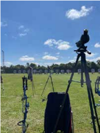
Compagnie des archers

Rejoignez-nous pour une matinée sportive sur nos chemins communaux ! Que vous soyez amateur de course ou de marche, cet événement est fait pour vous.